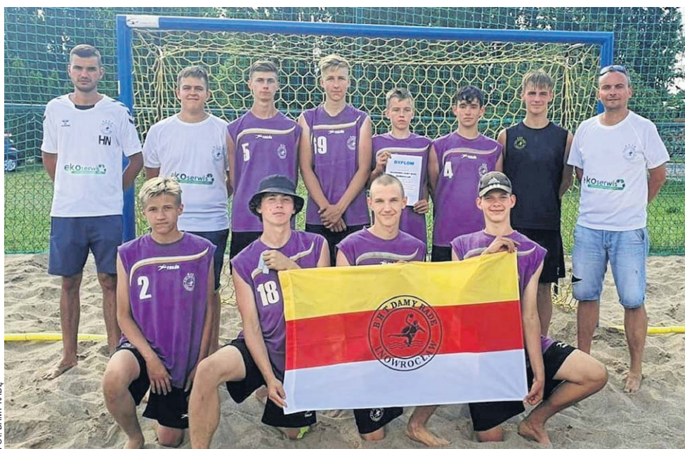
Tabela 1. MKS Kusy Szczecin, 2. Ekoserwis Damy Radę, 3. Gwardia Opole, 4. MKS Piotrkowianin I Piotrków Trybunalski. - Nasi zawodnicy zagrali bardzo dobre zawody z bardzo silnymi rywalami. Tym samym