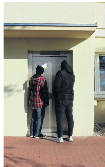
W ubiegłym roku w starostwie przy ul. Mątewskiej uruchomiono nową windę, dzięki której osoby niepełnosprawne mogą dostać się do budynku bez problemów

Pozyskane przez Powiat Inowrocławski środki pozwolą również na zakup laptopów dla szkół, umożliwiających realizację nauki zdalnej.