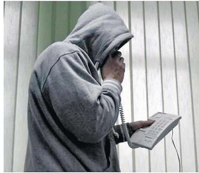
FOT. KPP INOWROCLAW