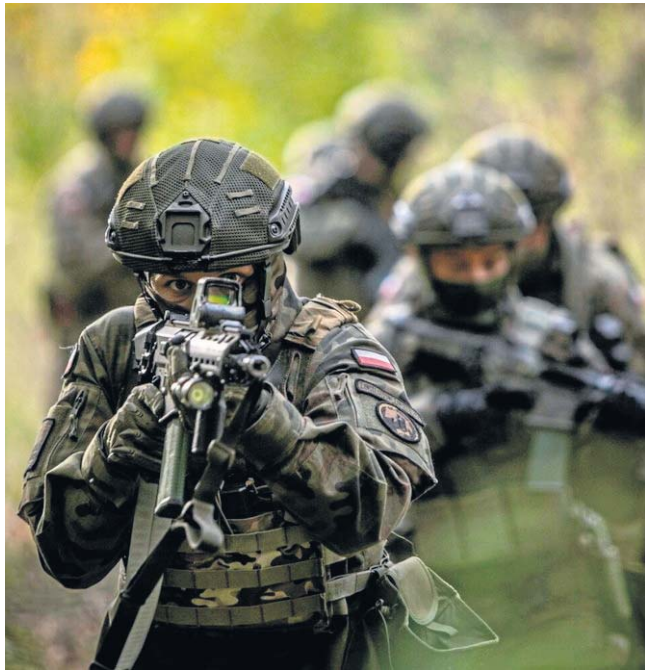
FOT. 8 K-PBOT

Atak prowadzony był z wody i z ładu. Żołnierze bronili się z wykorzystaniem wcześniej przygotowanych stanowisk ogniowych z użyciem m. in. uniwersalnych karabinów maszynowych UKM 2000P. Dodatkowo wgląd w pole walki w czasie rzeczywistym zapewniła Grupa Roz-