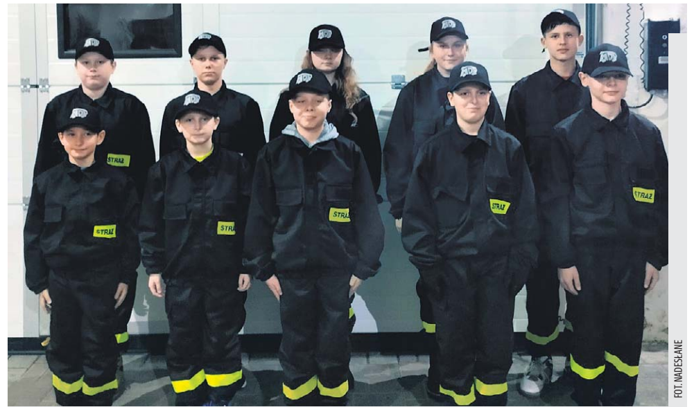
Grupa młodych strażaków w nowym umundurowaniu

Za uzyskane środki finansowe możemy zakupić brakujący sprzęt oraz umundurowanie dla Młodzieżowej Drużyny Pożarnej.