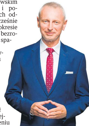
Prezydent Ryszard Brejza

na arenie ogólnokrajowej. Prezydent Miasta Inowrocławia wyróżniony został wieloma odznaczeniami i nagrodami. Od lat zajmuje najwyższe miejsca w prestiżowym ogólnopolskim ran-