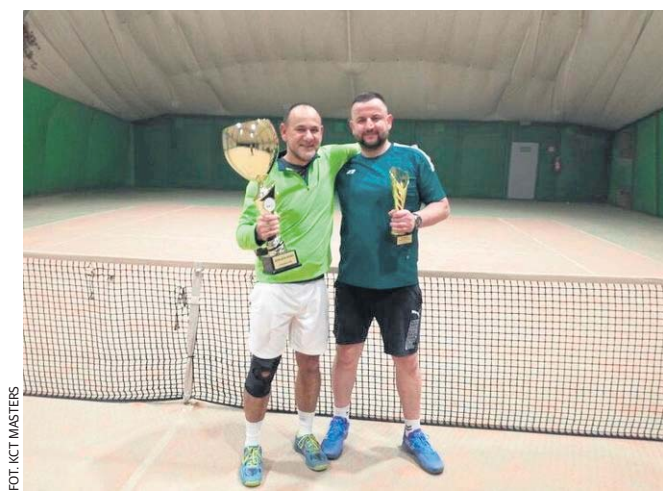
FOT. KCT MASTERS