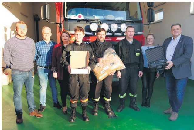
FOT. UG INOWROCŁAW