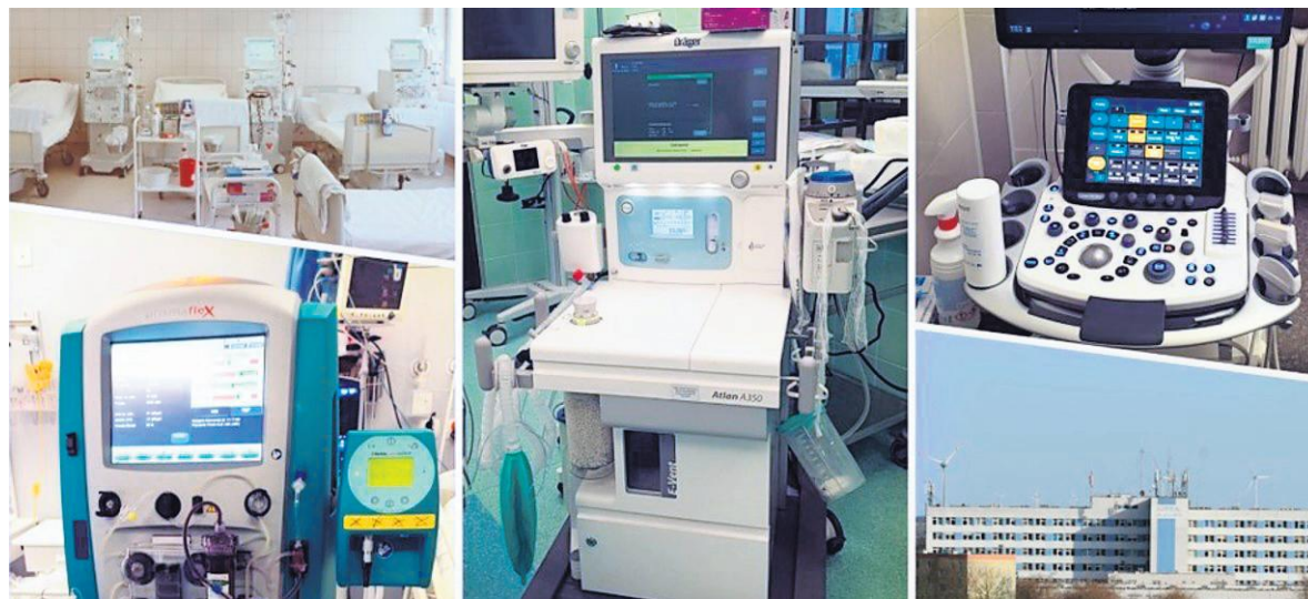
Samorządy już w ub. roku wsparły szpital, dzięki czemu możliwe było doposażenie lecznicy w sprzęt i aparaturę.

W ostatnim okresie szpital wspierały też inne samorządy. Z Gminą Inowrocław podpisaną umowę na dota-