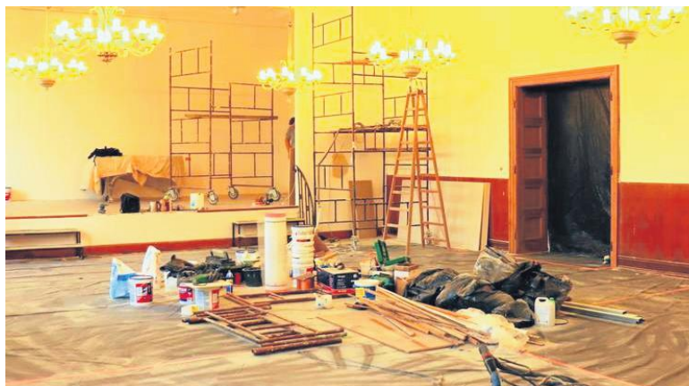
W III Liceum Ogólnokształcącym im. Królowej Jadwigi trwa też remont auli szkolnej, która będzie miała też nowe wyposażenie.

W Zespole Szkół Ekonomiczno-Logistycznych trwają prace wykończeniowe związane z remontem koryta-