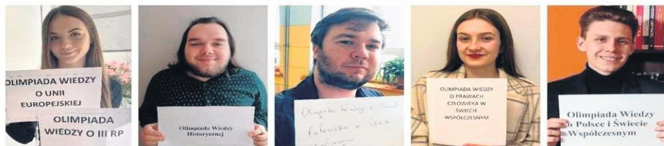
I Liceum Ogólnokształcące im. Jana Kasprowicza z Oddziałami Dwujęzycznymi w Inowrocławiu

Prawie wszyscy olimpijczycy z zakresu wiedzy o społeczeństwie i historii ucza lub uczyli się w klasach o profilu