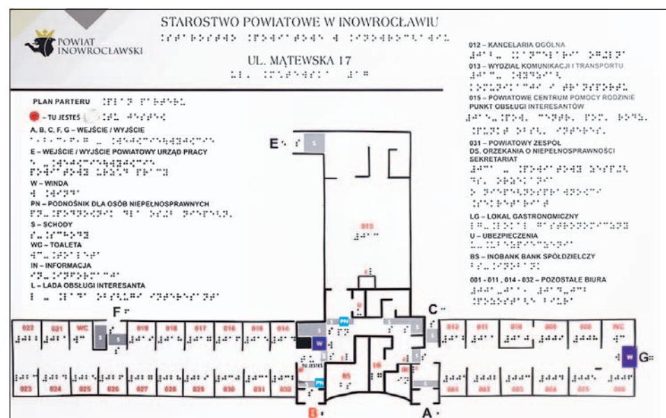
Tablica Tyflograficzna w Starostwie

Powiat pozyskał dodatkowe środki na zakupy, które mają niwelować skutki pandemii w ramach projektu unijnego „Wsparcie osób starszych i kadry świadczącej usługi społeczne w zakresie przeciwdziałania oraz rozprzestrzeniania się Covid-19, łagodzenia jego skutków na terenie województwa kujawsko-pomorskiego”. Był to unijny projekt partnerski realizowany przez samorząd województwa i wszystkie powiaty. Łącznie wydatko-