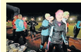
FOT. KRZYSZTOF BRACIUSKI

Thusty Czwartek coraz bliżej, więc wszystkich łasuchów, którzy lubią spalać kalorie Ośrodek Sportu i Rekreacji w Inowrocławiu zaprasza na IV Bieg po pączka. - Startujemy 8 lutego o godz. 19.00 ze Stadionu Miejskiego im. Inowrocławskich Olimpijczyków przy ul. Wierzbńskiego 2. Trasa, której długość w metrach nawiązuje do kaloryczności przeciętnego pączka, wynosi 3520 metrów. Bieg ma charakter rekreacyjny, bez pomiaru czasu i podziału na klasyfikację. Chodzi o dobrą zabawę i słodką niespodziankę, która będzie czekała na biegaczy po dotarciu na metę - zachęcają pracownicy OSiR Inowrocław. Regulamin wraz z kartą zgłoszeniową znajdują się na stronie www.osir.inowroclaw.pl . Szczegółowych informacji udziela Sekcja Marketingu i Organizacji Imprez Ośrodka Sportu i Rekreacji w Inowrocławiu przy al. Niepodległości 4, tel. 52 355 53 55, 531 995 335.