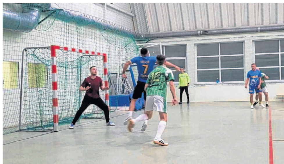
FOT. HALOWA LIGA W ROJEWIE

1. Nelesa Auto Sprint 31 punktów, 2. Dwór Biesiadny 30, 3. Radar Team 30, 4. Mieszanka Złotniki 21, 5. Typowe Pewniaki 20, 6. Galaktikos 19. (DM)