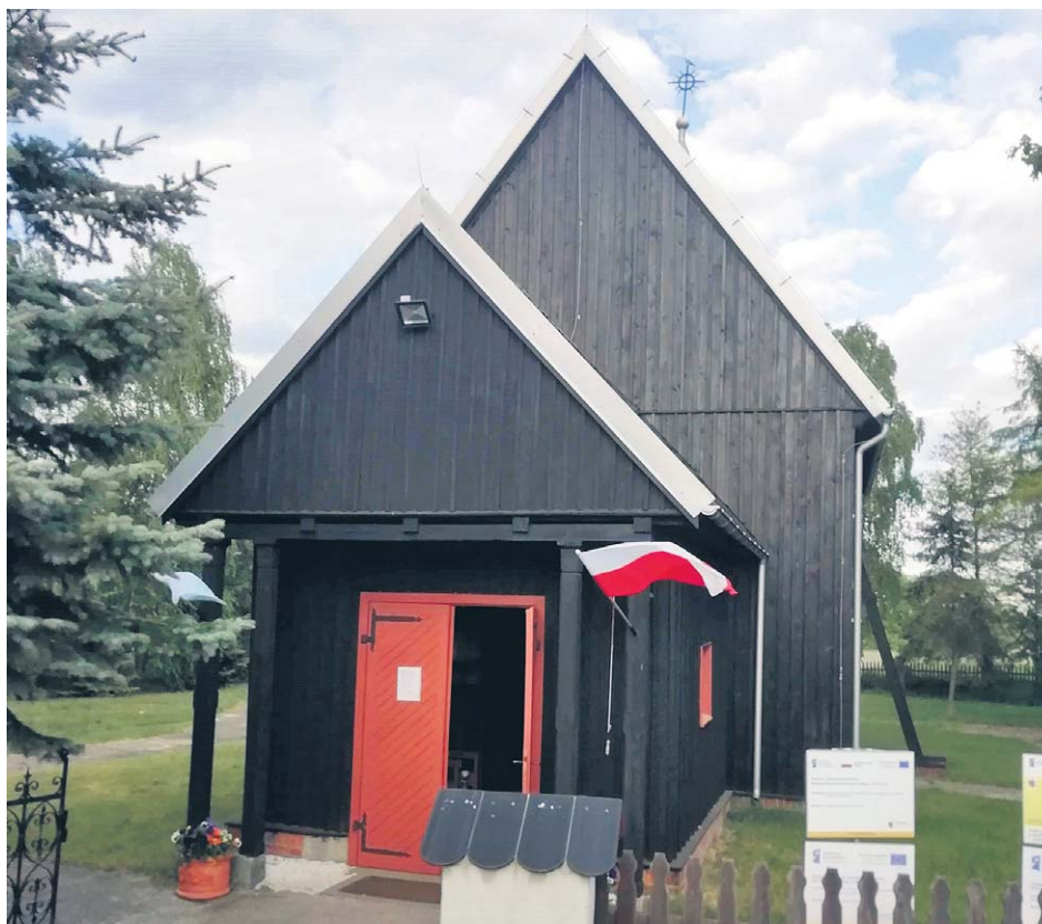
15 tysięcy złotych otrzymała w ubiegłym roku parafia św. Barbary i NMP Matki Kościoła w Rechcie na prace remontowo-konserwatorskie.

Podmiotami uprawnionymi do składania wniosku są osoby fizyczne lub jednostki organizacyjne posiadające tytuł prawny do zabytku wynikający m.in. z prawa własności, użytkownika wieczystego i trwałego zarządu. Powiat Inowrocławski bogaty jest w piękne zabytki.