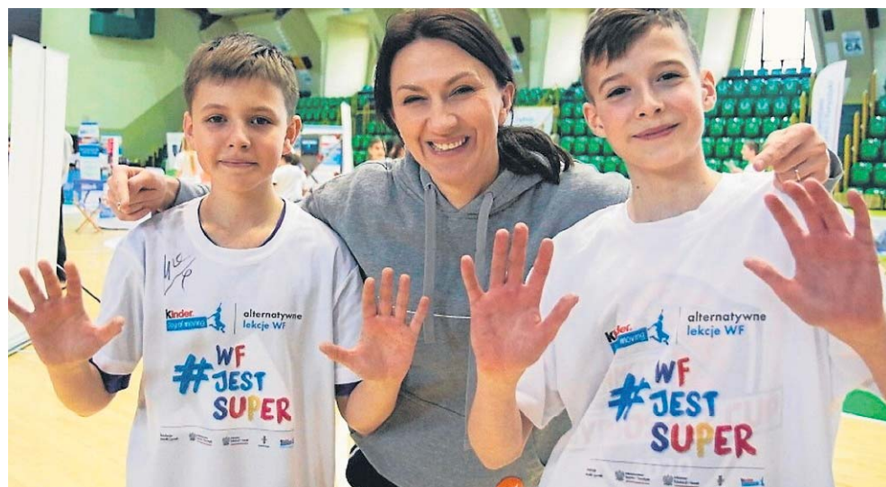
FOT. HALOWA LIGA W ROJEWIE

- Przyjeżdżamy do dzieciaków i pokazujemy im, jak