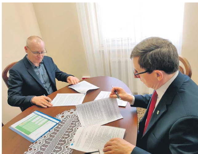
Podpisanie umowy z wykonawcą prac budowlanych

W Kruszwicy rozpoczęły się kolejne prace budowlane, tym razem związane z uporządkowaniem gospodarki wodno-kanalizacyjnej w obrębie kilku ulic na terenie gminy Kruszwica. Realizacja zadania potrwa 15 miesięcy i będzie realizowana w dwóch etapach: