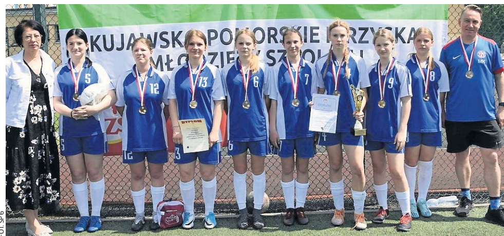
FOT. SP 6

Uczennice Szkoły Podstawowej nr 6 w Inowrocławiu triumfowały w Finale Kujawsko-Pomorskich Igrzysk Młodzieży Szkolnej w Piłce Nożnej Dziewcząt, który odbył się w Inowrocławiu. Po brąz sięgnęły zawodniczki SP nr 2 w Gniewkowie.