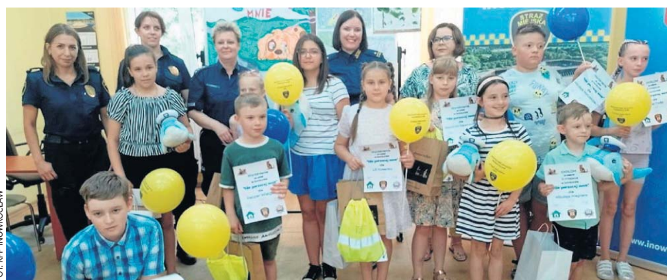
FOT. KPP INOWROCŁAW

Straż Miejska wspólnie z Komendą Powiatową Policji w Inowrocławiu oraz Schroniskiem dla Bezdomnych Zwierząt w Inowrocławiu zorganizowały konkurs w ramach kampanii prewencyjno-edukacyjnej pod nazwą „Nie porzucaj mnie”.