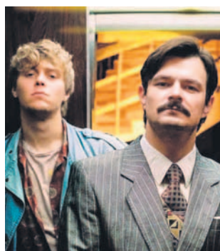
FILM SENSACYJNY 16