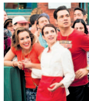
KOMEDIA ROMANTYCZNA 12

Mała Italia LITTLE ITALY, KANADA/USA 2018