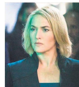
FILM SF 12