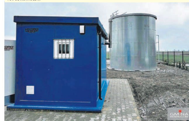
FOT. UG INOWROCLAW