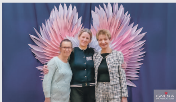
FOT. UG INOWROCŁAW