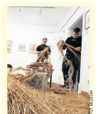
FUTRO DLA „MICHY” WSZYMBORZU

W Szymborzu, w oddziale Muzeum im. Jana Kasprowicza - Domu Rodziny Jana Kasprowicza, mieszkańcy i muzealnicy wyplatają futro dla „Michy”. Akcja będzie kontynuowana jeszcze w tym miesiącu. Trwa plectenie nowego słomianego stroju dla szymborskiego niedźwiedzia z orszaku kozy. Jego strój jest ciężki, najtrudniej się w nim poruszać, dlatego często „Michu” zamyka żwawy pochodź przebierańców. Słomy, z której jest wykonany jego strój, musi być dużo - jej obfitość i kosmatość symbolizują bogactwo i urodzaj. Dwie akcje plectenia odbywały się w listopadzie, a kolejne zaplanowano na najbliższą niedzielę w godzinach pracy oddziału (10.00-16.00) oraz 17 grudnia.