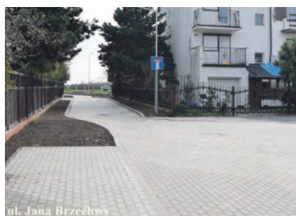
ul. Jana Brzechwy

W 2023 roku kontynuowana była także modernizacja fragmentu średniowiecznego muru obronnego przy ul. Kasztelańskiej. Zadanie dofinansowane w 85% ze środków unijnych, 10% z budżetu państwa i 5% z budżetu Miasta.