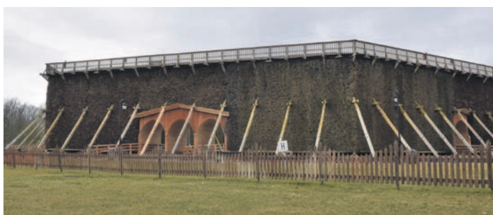
ul. Stefana Knasta