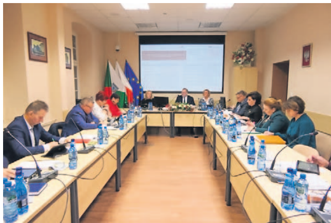
FOT. UG INOWROCŁAW

Dochody i wydatki budżetu, czytamy w uchwale, wyniosą blisko 96,5 mln zł. Niemal 27% kwoty, tj. po-