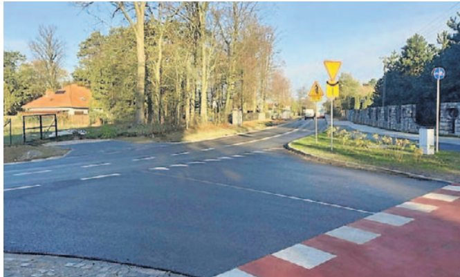
Niedawno wyremontowano trasę Balczewo - Dziennice. Drogi są jednym z priorytetów Starosty Inowrocławskiego Wiesławy Pawłowskiej, która bardzo często osobiście sprawdza ich stan i przebieg inwestycji.

Inwestycja kosztowała łącznie ponad 12,5 mln zł. Ma ona znaczenie za-