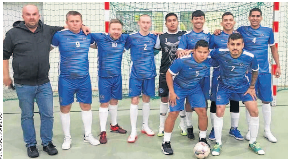
FOT. HALOWA LIGA ROJEWIE

Odbyły się następne spotkania w halowej lidze amatorów w Rojewie. Po dziesięciu meczach na czele jest drużyna Nelesa Auto Sprint, która o punkt wyprzedza Dwór Biesiadny i Radar Team.