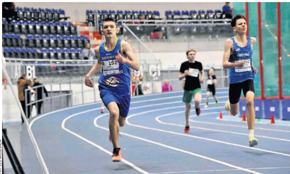
FOT. LZS KRUSZWICA

Na Halowych Mistrzostwach Województwa Kujawsko-Pomorskiego w Toruniu w sobotę znakomicie zaprezentowali się lekkoatleci KSLZS Kruszwica. Wywalczyli aż trzynaście krążków.