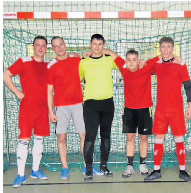
FOT. HALOWA LIGA W ROJEWIE

1. Nelesa Auto Sprint 37 punktów, 2. Dwór Biesiadny 33, 3. Radar Team 30, 4. Mieszanka Żłotniki 24, 5. Nowa Wieś Wielka 22, 6. Typowe Pewniaki 20, 7. Spichlerz Jaskóły/Płonkówko 19, 8. Galaktikos 19. (DM)