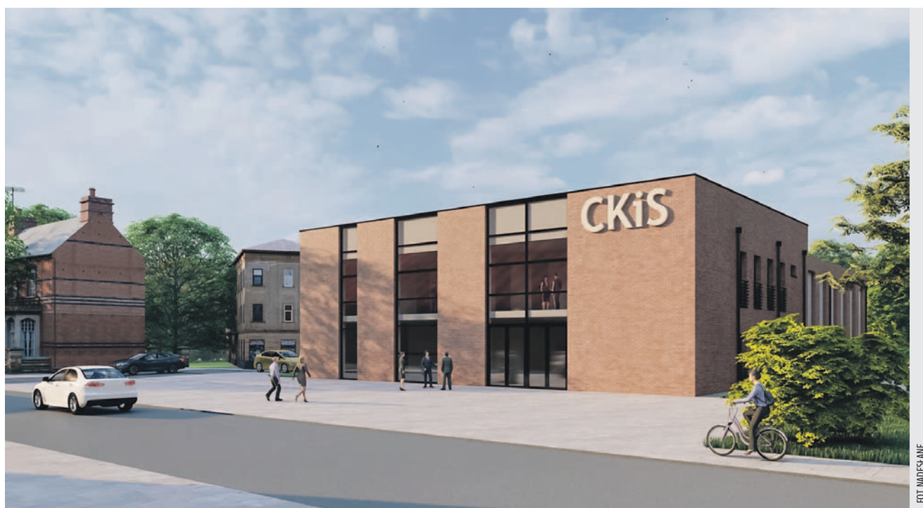
Koncepcja wstępna programu funkcjonalno-użytkowego

Przedmiotem projektu jest stworzenie nowoczesnej infrastruktury kulturalnej spełniającej obecne standardy stawiane instytucjom kultury. Prace przewidziane w ramach projektu będą związane z remontem i rozbudową budynku Centrum Kultury i Sportu w Kruszwicy o dodatkowe po-