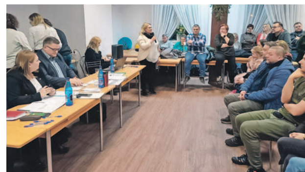
FOT. UG INOWROCLAW

Wybranim serdecznie gratulujemy i życzymy owocnej pracy.