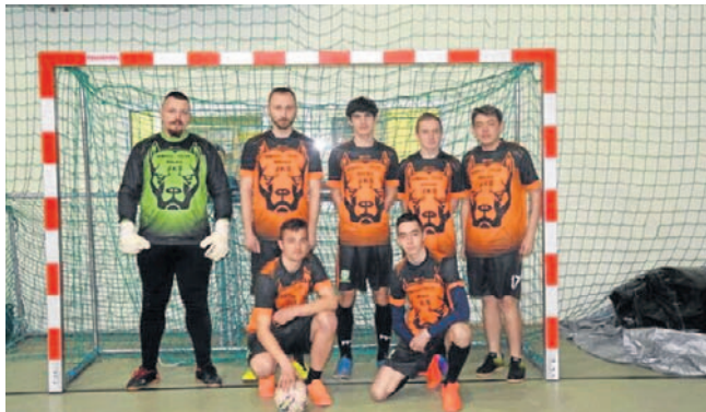
FOT. HALOWA LIGA ROJEWIO

Pozycje 9-12: Costaimmo Nieruchomości - Spartakus Zjednoczeni, Orły Górskiego - Zimny Lech Liszkowo (28 lutego od godz. 18.25). (DM)