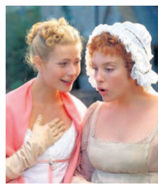
KOMEDIA ROMANTYCZNA 12