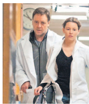
FILM SENSACYJNY 16