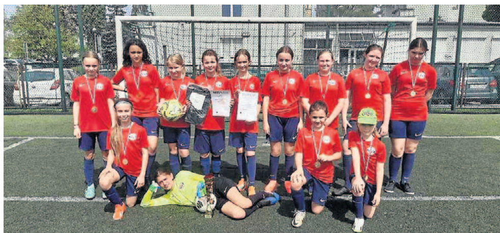
FOT. SP 6

Najmłodsze adeptki piłki nożnej stanęły do walki o Mistrzostwo Powiatu Inowrocławskiego Dziewcząt Szkół Podstawowych w piłkarskich szóstkach. Bezapelacyjnie najlepsze były ponownie uczennice inowrocławskiej „Szóstki”.