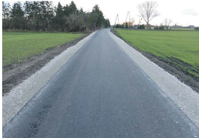
Droga Sławęcinek - Cieślin