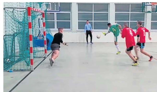
FOT. HALOWA LIGA ROJEWO