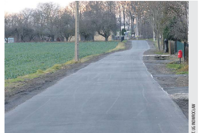
Ul. Nowe Osiedle w Jaksicach